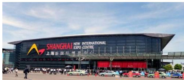
上海新国際博覧中心